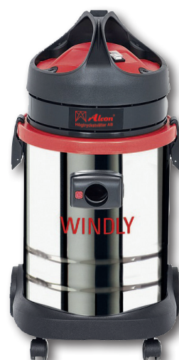
Windly 515 - Delta 300

ALCON Windly är en populär torr- och våtdammsugare för industri och hushåll.