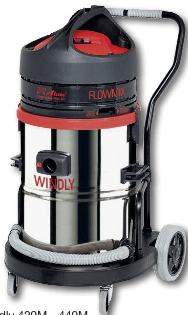
Windly 429M - 440M